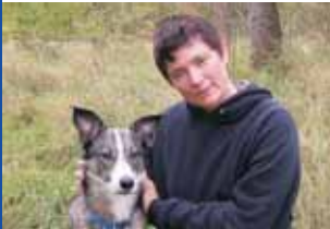
Mit Frida, meiner ausgeglichenen Border-Collie/Labrador-Hündin

Da dieser Prospekt Ihnen nur sehr begrenzt aufzeigen kann, was ich anbiete, empfehle ich Ihnen einen Blick in meine Homepage ( www.tiere-als-begleiter.de ), wo Sie eine Reihe von Fallbeispielen finden und die Erklärung einzelner Therapieschritte bzw. -möglichkeiten.