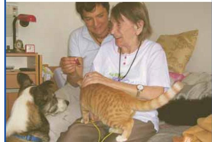
Zum Beispiel: Tiergestützte Aktivität im Altersheim

Schulungen von Ehrenamtlichen im Hundebesuchsdienst, Praxis-Workshops mit Erziehern/Lehrern und Blockseminare in wissenschaftlichen Einrichtungen oder auch Vorträge zu Fachthemen sind nur einige meiner Schulungsangebote - ich richte mich ganz auf Ihr konkretes Interesse ein.