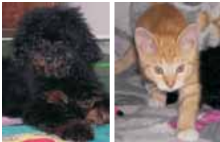
Amelie, kuscheliger Toy-Pudel, und Filou, zutrauliches Katerchen

TAB TIERE ALS BEGLEITER Tiergestützte Therapie & Pädagogik