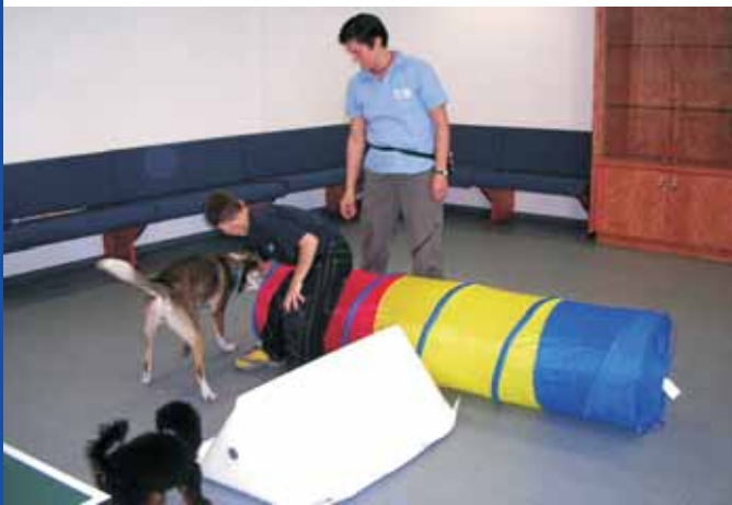
Hindernisparkours: übt Koordination, Kooperation, Konzentration uvm.

Inzwischen gibt es einige Kostenträger (z.B. Jugendamt und Unfallkassen), von denen man Zuschüsse erhoffen kann. Sprechen Sie mich an, wir werden eine Lösung suchen.