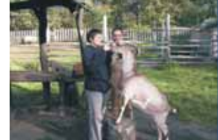
Zum Beispiel: Tierhaltung in einer Jugendeinrichtung

Wenn Sie beabsichtigen, ein Tier in die Familie zu holen oder Fragen zu einem bereits vorhandenen Familientier haben, kann ich Sie beraten und betreuen. Dies gilt auch für die Anschaffung eines Behindertenbegleithundes oder eines anderen Begleittieres.