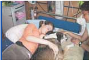
Körpernähe und Leben spüren: ein apallisches Mädchen in der Reha

Von tiergestützten Therapien kann grundsätzlich jeder Mensch profitieren, ob jung oder alt. Besonders hilfreich ist beispielsweise die Unterstützung medizinischer Therapien, wie Ergo-, Logo- und Physiotherapie, für Menschen mit Behinderung oder nach Unfällen.